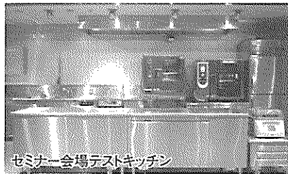
セミナー会場テストキッチン