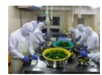
農産加工の実践研修