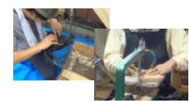
養殖籠補修、木工技術習得