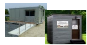
休憩所、トイレの整備