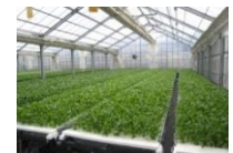
農業生産施設 (水耕栽培ハウス)