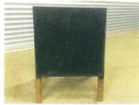
A型看板（両面使用可）