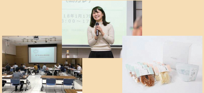
集合研修(左)、受講生によるプレゼンテーション(中央)、受講生の商品(右)

※スモール・ビジネスとは、中山間地域の資源を活用し、魅力ある商品やサービスを開発し、外資を稼ぐ取組の事です。