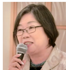
[報告者] 有限会社やんばるライフ 専務取締役