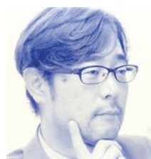
[報告者] モルツウェル株式会社 代表取締役社長