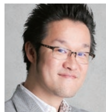
[報告者] 株式会社イベント21 代表取締役社長