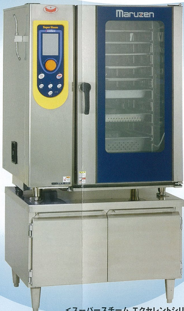
<スーパースチーム エクセレントシリーズ> ●SSCX-10NU+キャビネット架台 <軟水器付>